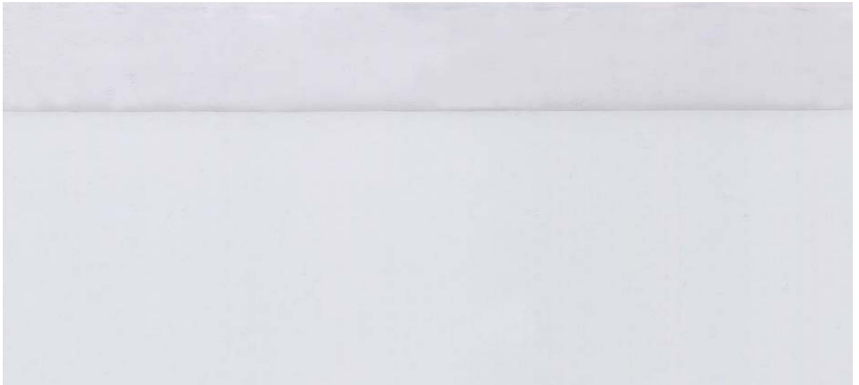
6146 CRISTALPLUS 500 2S