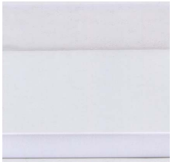
6026 CRISTALPLUS WINDOW 500 2S